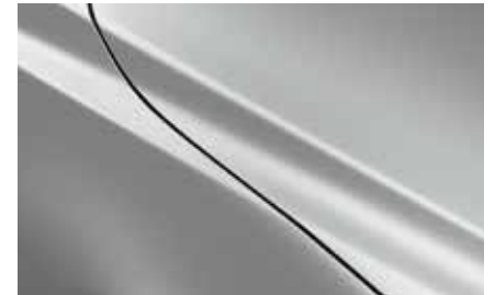
Ceramic Silver (47A)