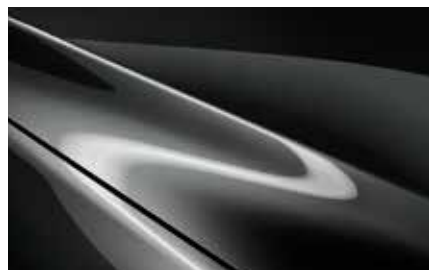
Machine Grey (46G)