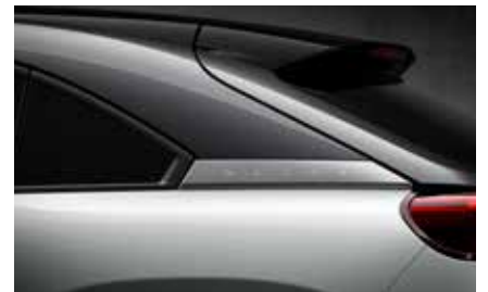
Ceramic White (Multitone) (48A)*