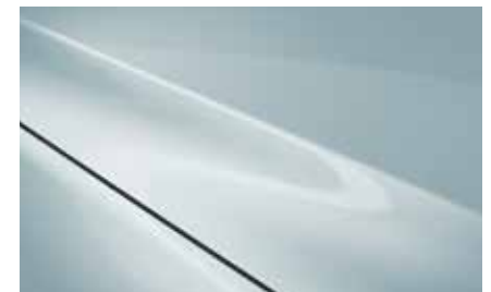
Air Stream Blue (52L)