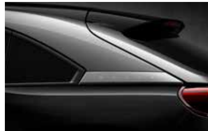
Jet Black-Silver (Multitone) (49P)*