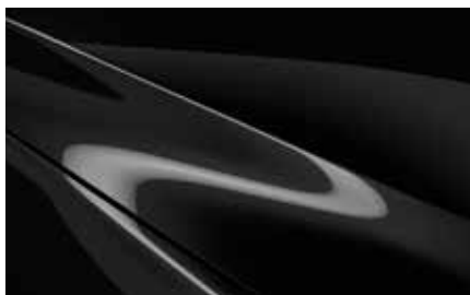
Jet Black (41W)