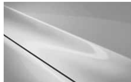
Aero Grey (52C)