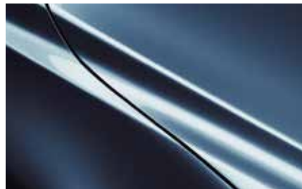
Eternal Blue (45B)