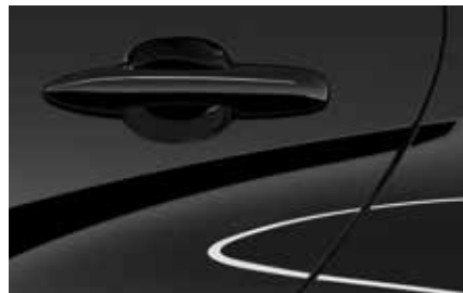
Opera Black (49W)**