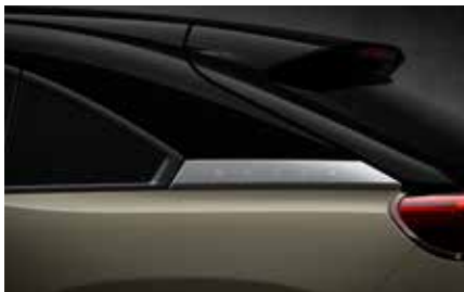
Zircon Sand (Multitone) (49T)*