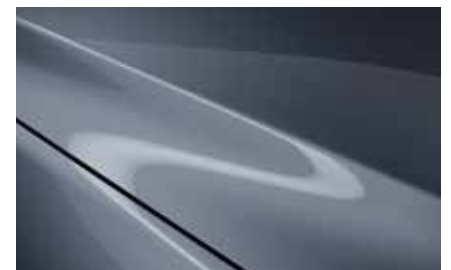
Polymetal Grey (47C)