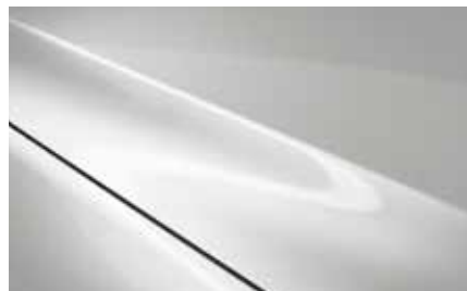
Rhodium White Metallic (51K)