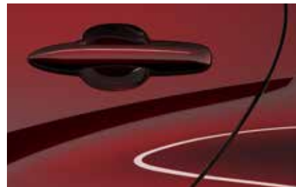
Formal Red (A9V)**