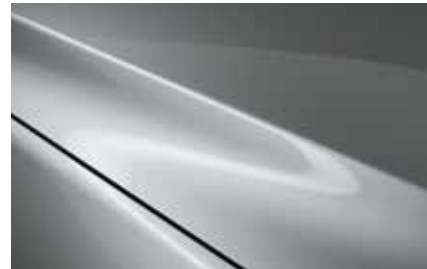
Sonic Silver (45P)