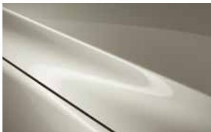
Platinum Quartz (47S)