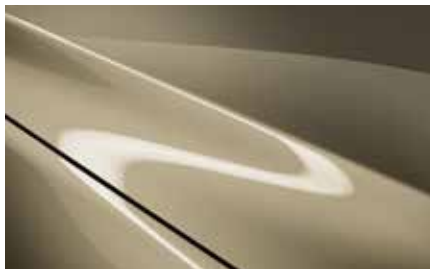
Zircon Sand (48T)