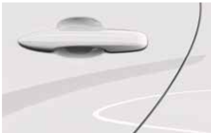
Lunar White (A8D)**