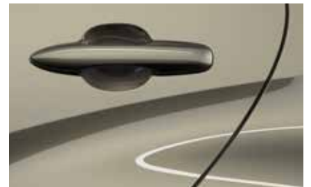
Monument Bronze (48H)**