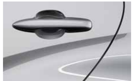
Stormy Silver (49S)**