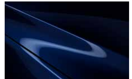
Deep Crystal Blue (42M)