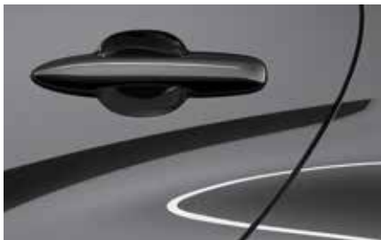
Lead Grey (48G)**