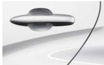
Northern White Pearl (48D)**