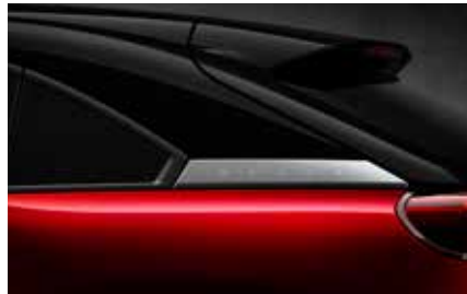
Soul Red Crystal (Multitone) (49V)*