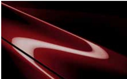
Artisan Red (51F)***